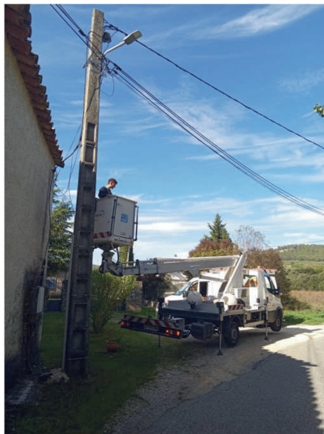
Deuxième tranche des travaux pour le passage à la LED des éclairages publics