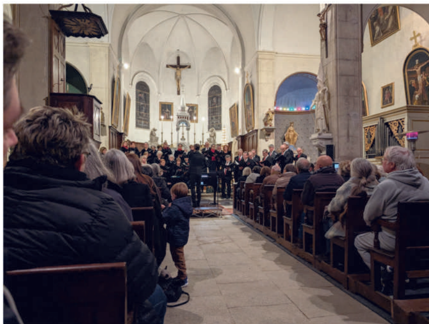
Concert de Noël à l'église : Chœur européen de Provence