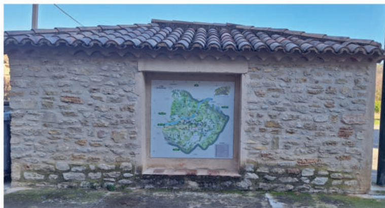
Plans de la commune actualisés